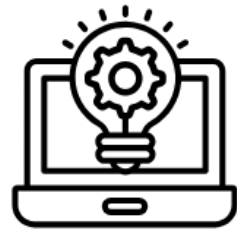
Innovation et Digital