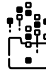
Chief Data Officer